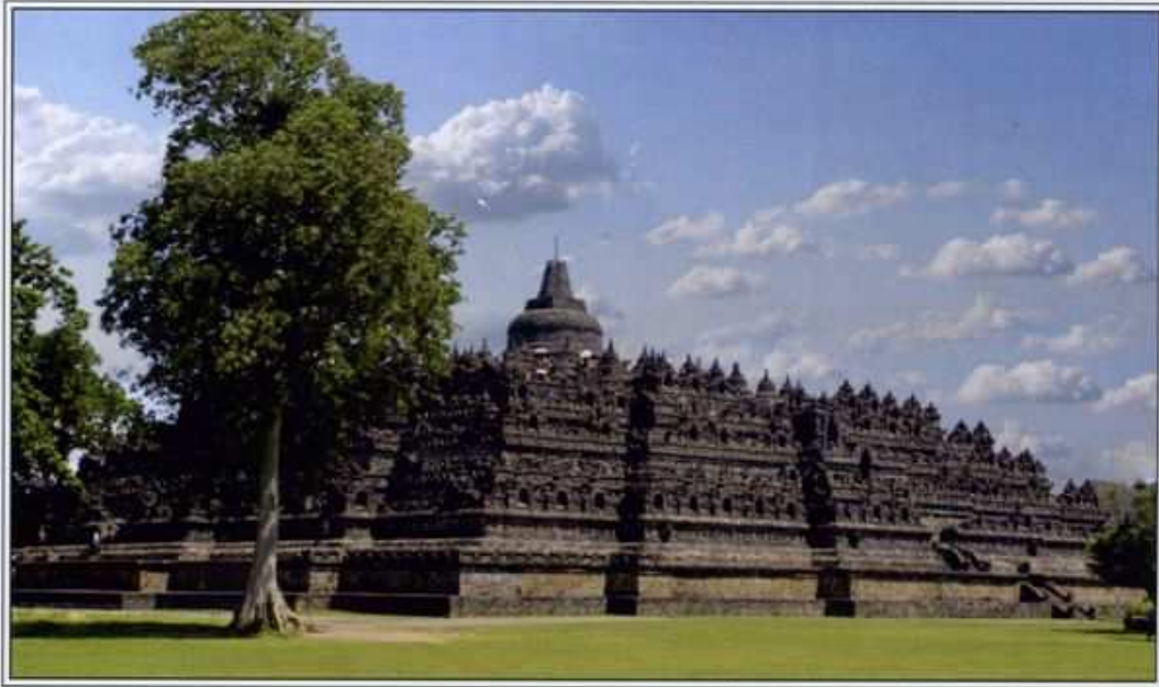
This 9th-century temple of Borobudur is the largest Buddhist monument in existence